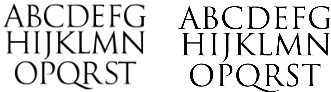
FIGURE 1 – Les caractères de la colonne trajane vus par Goudy (à gauche) et Adobe (à droite)

Trajan d'Adobe Au catalogue d'Adobe 19 , on trouve aussi une fonte Trajan dessinée par Carol Twombly en 1989, qui existe en versions normale et pro (figure 1-droite).